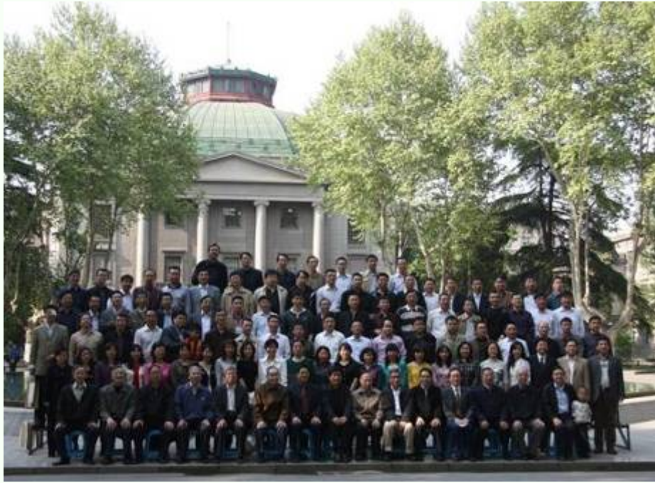
(自动化学院 86 级同学毕业二十周年聚会母校合影)