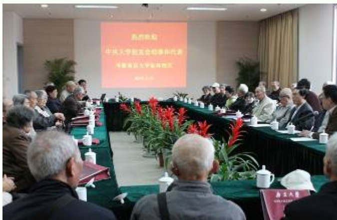
中央大学在宁校友在南京大学仙林校区新闻中心举行座谈会