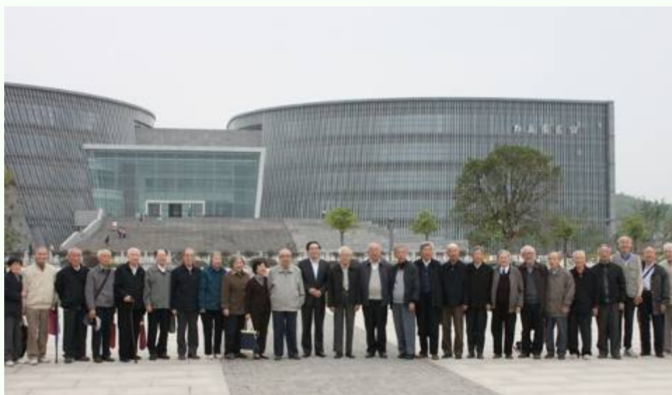
中央大学在宁校友在南大仙林校区杜厦图书馆前合影