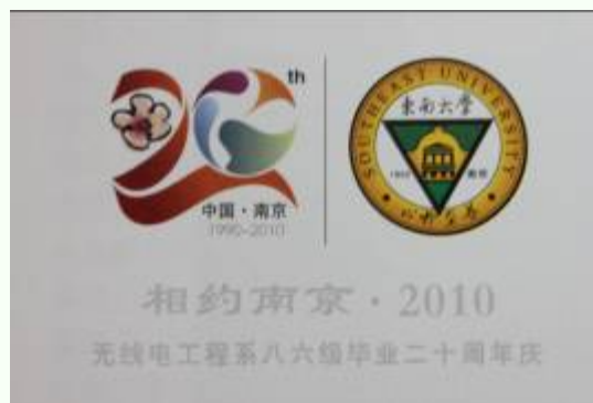
(纪念 T 恤上的标志)

5 月 1 日，四牌楼校区内笑语欢声，4 系 86 级 100 余位校友在毕业 20 周年际返校欢聚。赵晖、田丁等十余位热心校友从 2009 年 8 月初起就开始精心策划此次活动。校友们设计并捐赠的金色琉璃建筑模型——江南院，被永远珍藏。