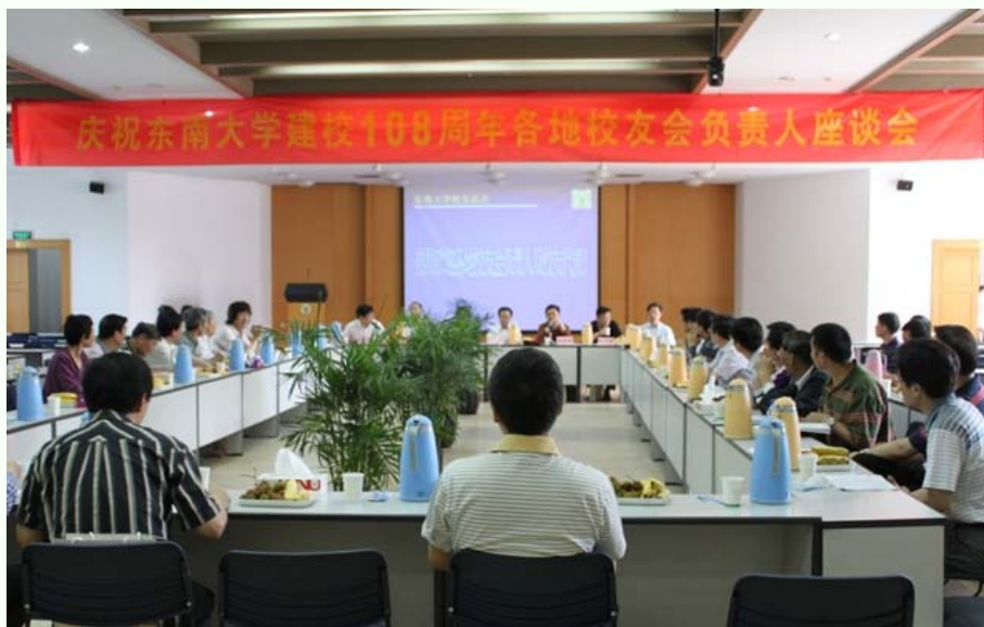
(6月6日下午校群贤楼报告厅召开各地校友会负责人座谈会)