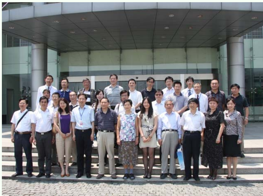
（在三宝集团门前合影）