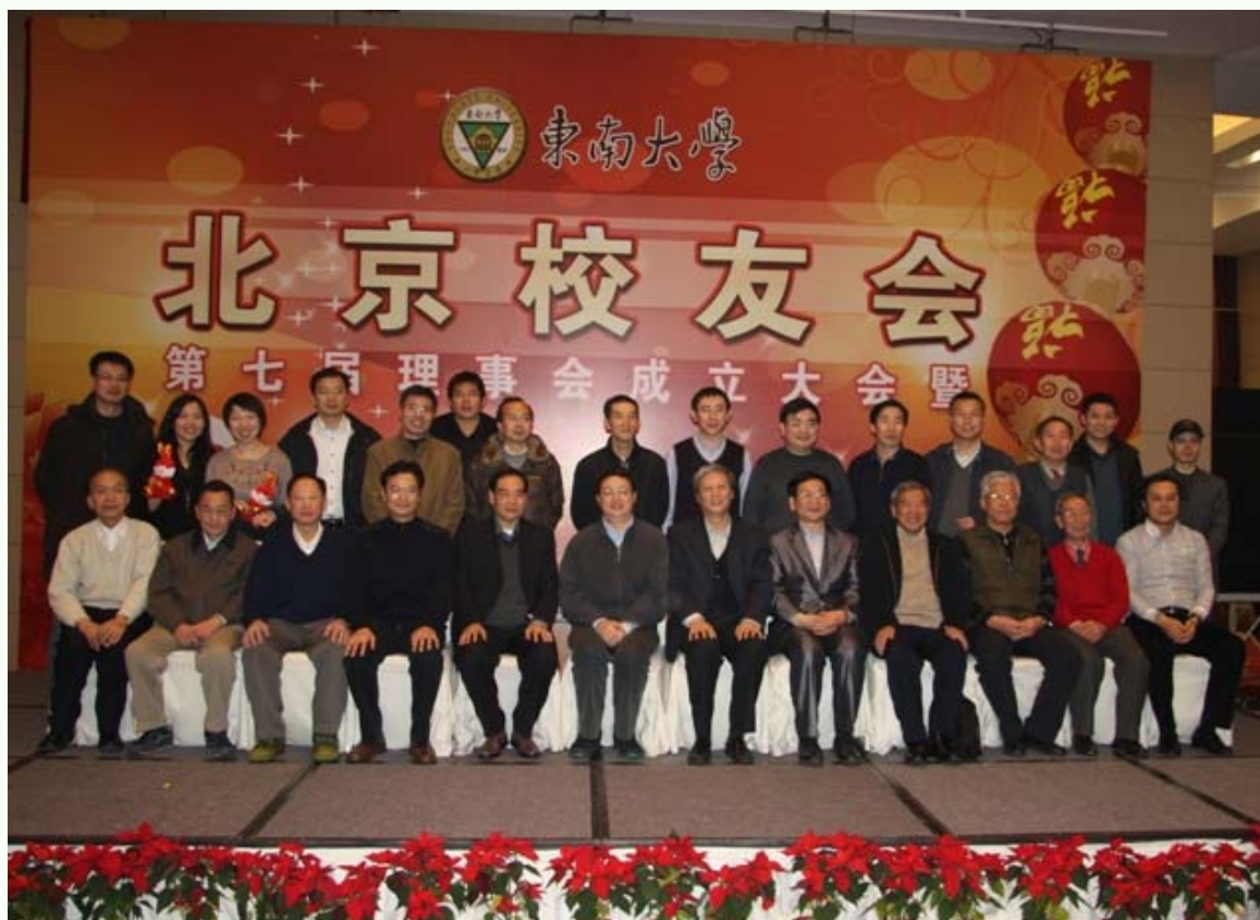
母校及北京校友会领导与北京校友会动力分会部分校友合影