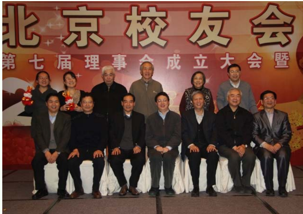
母校及北京校友会领导与北京校友会建筑分会部分校友合影