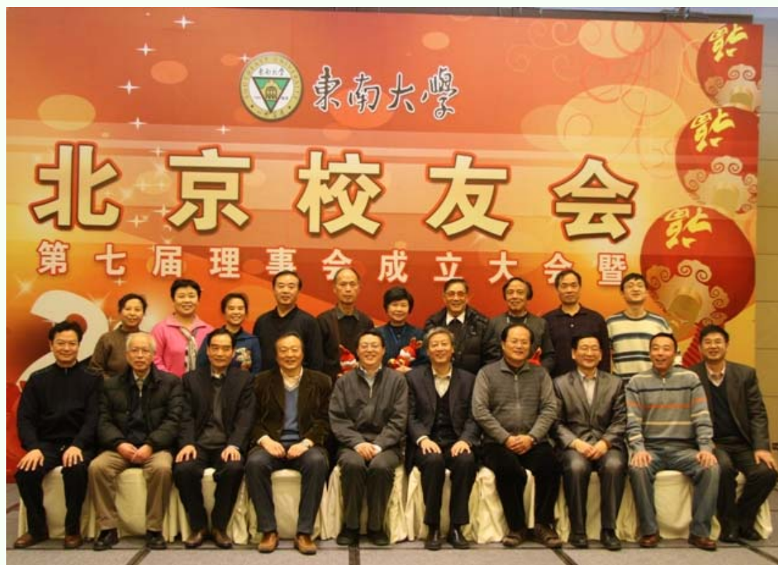
母校及北京校友会领导与北京校友会电子分会部分校友合影