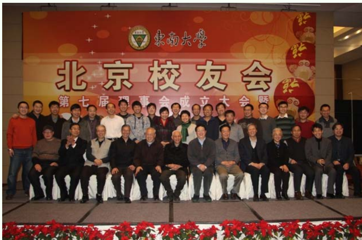
母校及北京校友会领导与北京校友会机械分会部分校友合影