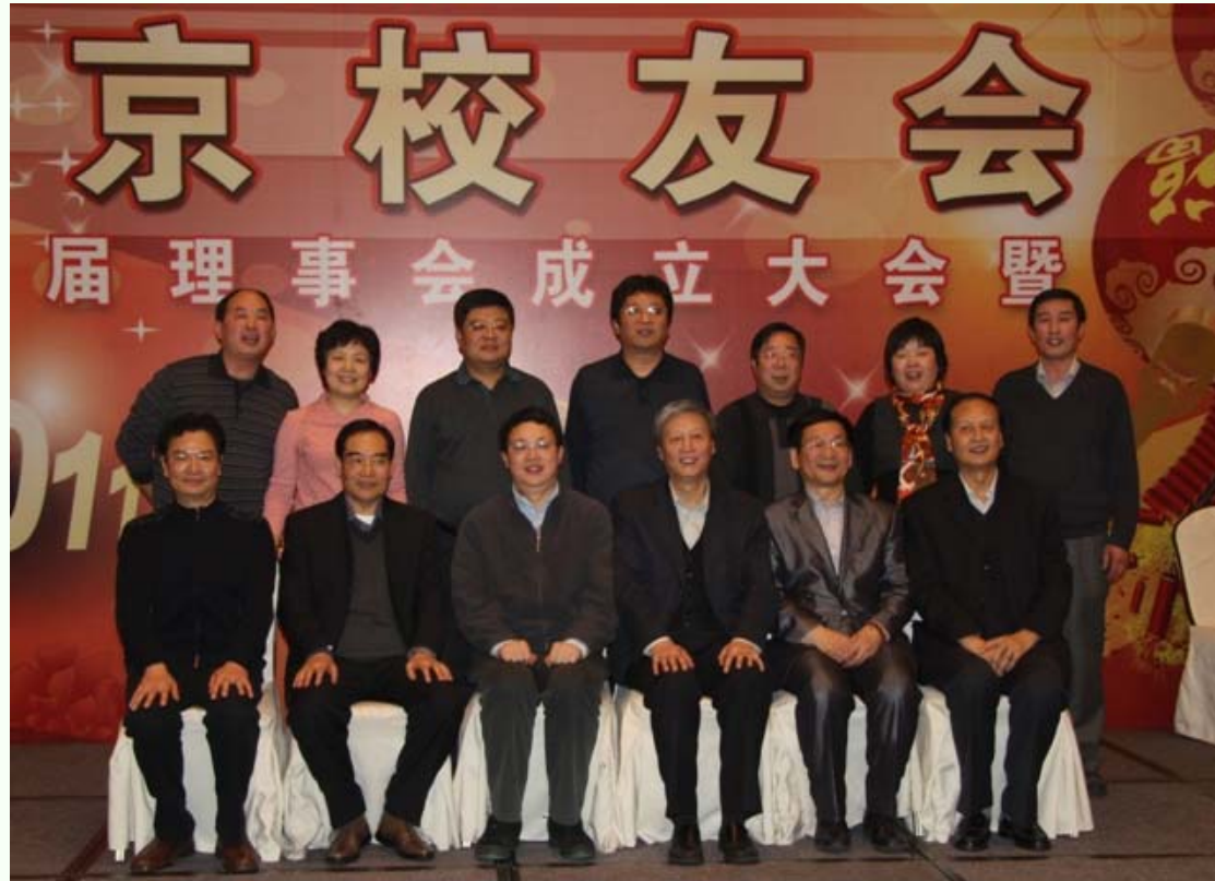
母校及北京校友会领导与北京校友会地质分会部分校友合影