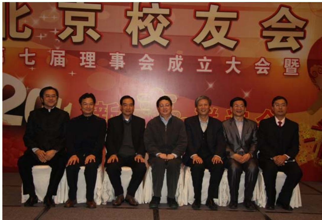
左惟常务副书记（右四）与北京校友会新一届理事会部分负责人合影