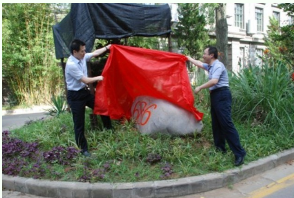
“686”纪念石和捐赠的纪念松树揭幕仪式