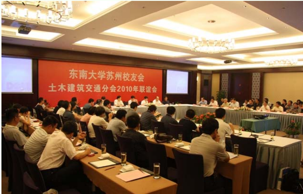
苏州校友会土木建筑交通分会 2010 年联谊会会场