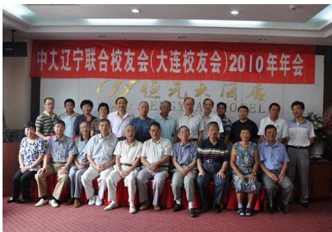
(左图)到会的东南大学校友